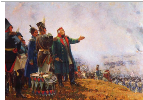
С. Герасимов. Кутузов на Бородинском поле