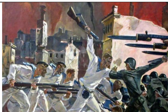
А. Дейнека Оборона Севастополя (фрагмент)

Учитель. Перед вами картины, которые рассказывают о героических страницах истории нашей Родины. Первое полотно – война с французской армией Наполеона в начале XIX века, а Великая Отечественная война, битва за Севастополь – сюжет второй картины. Какая цель объединяет солдат нашей доблестной армии?