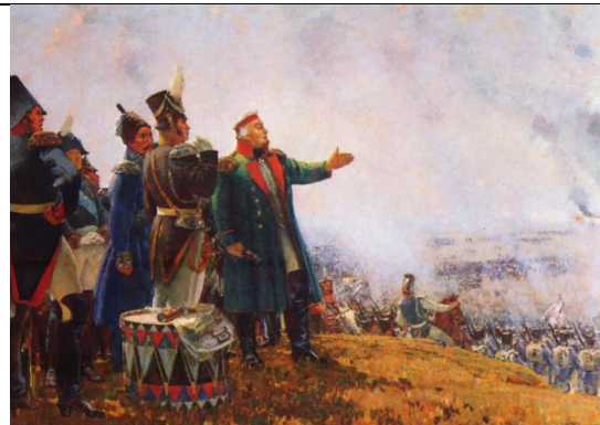
С. Герасимов. Кутузов на Бородинском поле