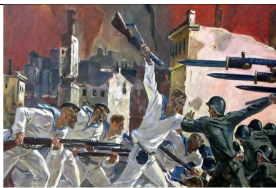
А. Дейнека. Оборона Севастополя (фрагмент)

Рождение Красной Армии или Первый бой с немцами под Псковом 23 февраля 1918 г. (фрагмент картины)