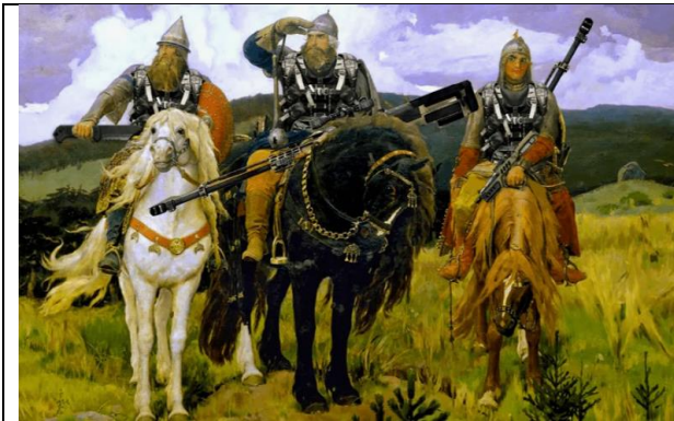
В. Васнецов. Три богатыря